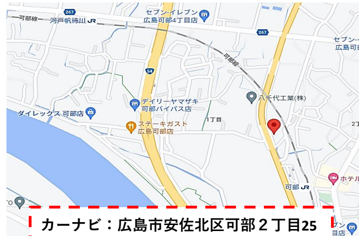
カーナビ：広島市安佐北区可部2丁目25