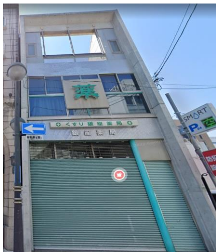
ルーフバルコニー